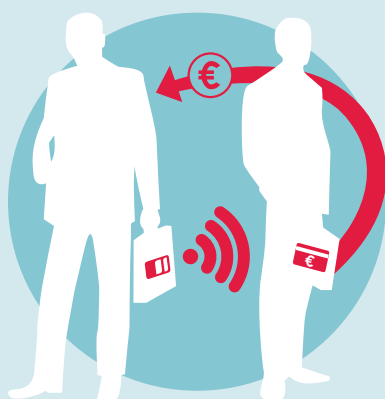
ohne RFID-Blocker Karte